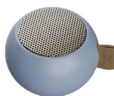
クラウディブルー