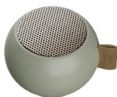
ダスティオリーブグリーン