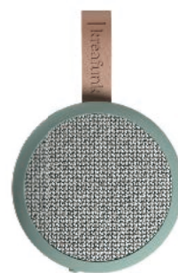
ダスティグリーン