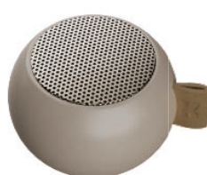
アイボリーサンド