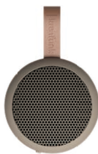
アイボリーサンド