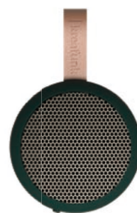
シェイディーグリーン