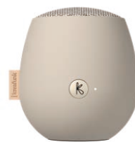
アイボリーサンド