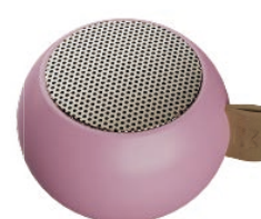
フレッシュピンク