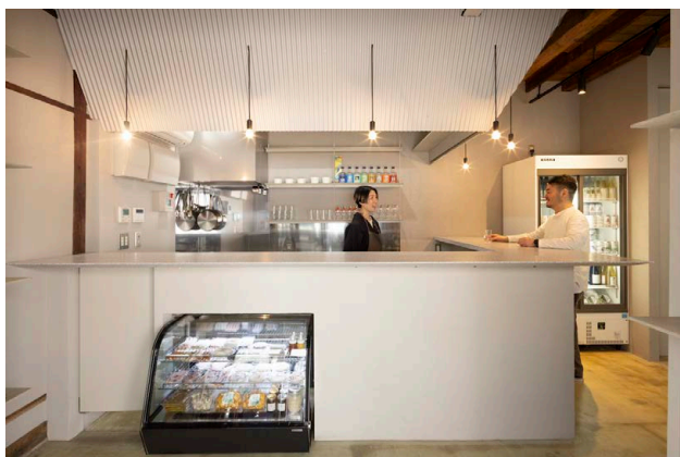
エントランスエリア