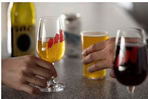
角打エリアではワイン、ビールなどを楽しめる