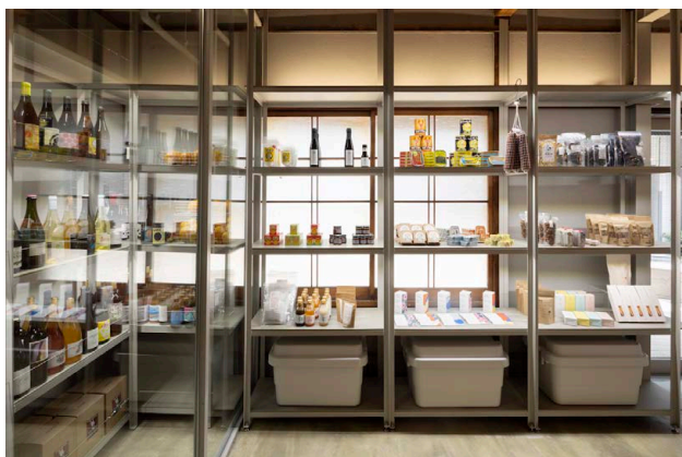
左手 ワインセラー