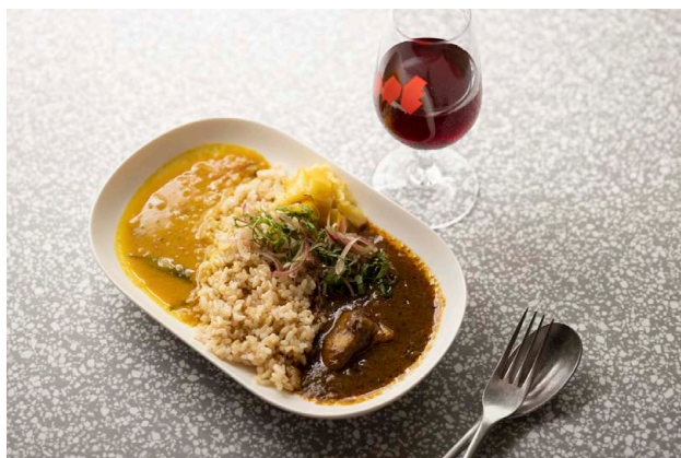
「水曜カレー」のカレー