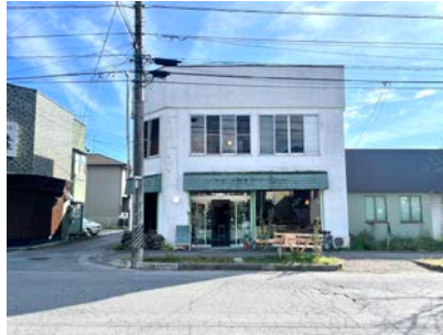
E. CORNER SHOP MIYOTA