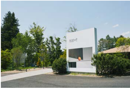
A. MMoP、Iagom (MMoP内)