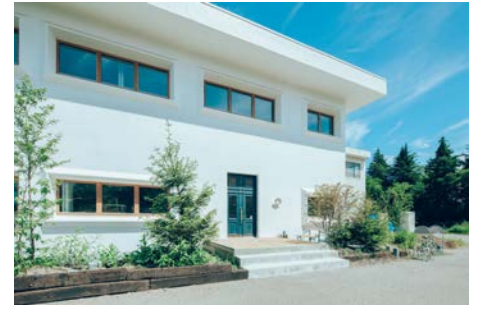
C. haluta still