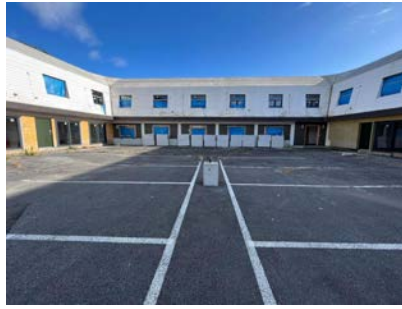
B. haluta BLÅ (ブルウ)