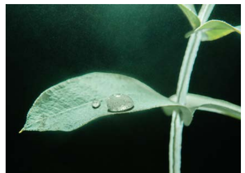
ユーカリ（イメージ）