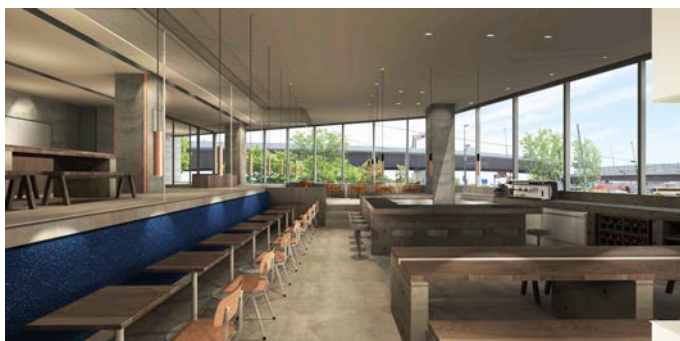
1Fレストラン (イメージ)