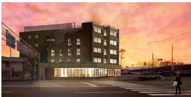
ホテル外観 (イメージ)

■京都や周辺の琵琶湖や瀬戸内など、人気のサイクリングコースに囲まれた立地のため、サイクリストのお客様にお楽しみいただけるよう、1階の4部屋は、そのまま自転車を持ち込める仕様になっています。