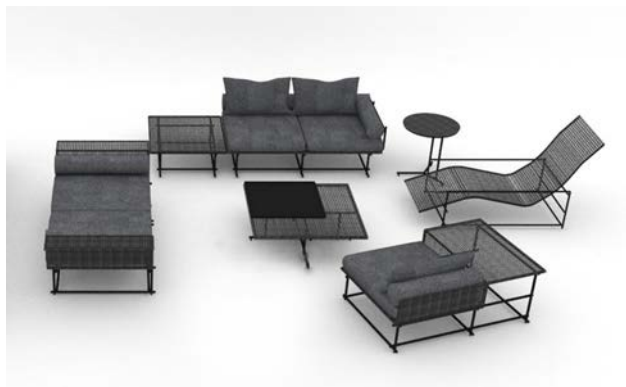
PATIO PETITE MA Series by SUPPOSE DESIGN OFFICE

アウトドアファニチャーブランド PATIO PETITE MA Series by SUPPOSE DESIGN OFFICE デザインオフィスnendoによる新作の発表 / 簡易トイレ minimLET by nendoの販売開始