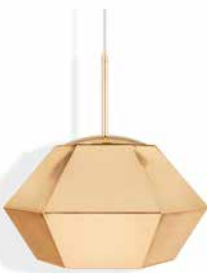
CUT SHORT PENDANT (GOLD)