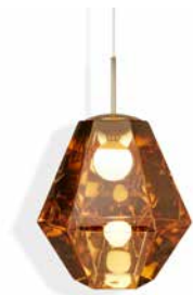
CUT TALL PENDANT (GOLD)

カットは、内包された光を変幻次第に操る、近未来的で切子細工のような照明です。最新の鏡面仕上げを活用することにより、点灯した時に半透明状の万華鏡のような視覚効果が表れます。また、シェードの内側に真空蒸着技術を用いてコーティングすることにより、光が無数に反射し、眩惑的な光を放つ宝珠のような視覚効果を生みます。この作品は、トム・ディクソンが常に追い続けている反射、透過という光による視覚効果における飽くなき探求心から生まれました。