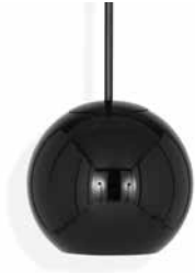
COPPER ROUND PENDANT 25 (BLACK)

専用モールド (型) で製作された美しい球体のシェードに高度な真空蒸着技術による塗装を施し、鏡面仕上げにしたコッパーに、新色のBLACKとBLUEが加わりました。周囲の風景をシェードに映し出し、空間の中で、頭上に浮かぶヘリウム風船のように存在感を放ちながらも視覚的軽快さを兼ね備えた、トム・ディクソンの代表作の1つです。サイズは25cmと45cmの2タイプ。