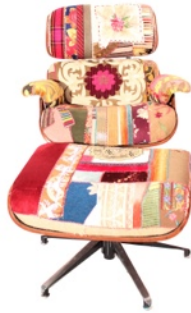
BOKJA EAMS/BOKJA EAMS/BOKJA BOKJA