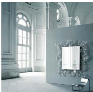
左 : Stum und Drang /GLAS ITALIA