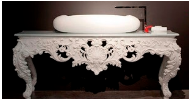
中 : Wonders Collection/TOYO KITCHEN STYLE Selection