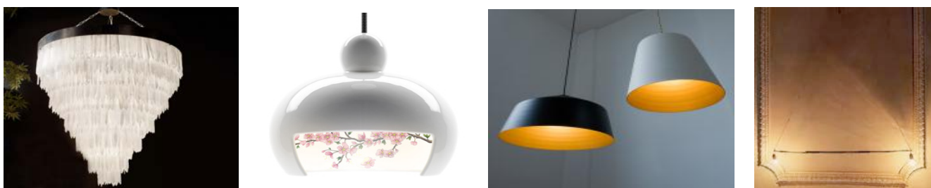
SELENITE STONE juuyo moooi CIRCUS/innermost HAUS LANGE LAMP/Memphis

ヒーリング効果のあるセレナイトストーンの照明の取り扱いもスタート。セレナイトストーンは「聖母マリアのガラス」とも呼ばれる ジェムストーン。強力な浄化作用、癒し、ヒーリング効果を持ちます。語源はギリシャ神話の月の女神「セレーネ」に由来するという 説もあり、月明かりを彷彿とさせます。その他新作も含め、インテリアの新しい可能性を提案します。