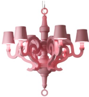
PAPER CHANDELIER pink/moooi/Studio Job