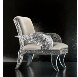
右 : Fly me to the moon/TOYO KITCHEN STYLE Selection

トーヨーキッチン&リビング PRサポート : HOW INC. info@how-pr.co.jp Tel:03-5414-6405, Fax:03-5414-6406