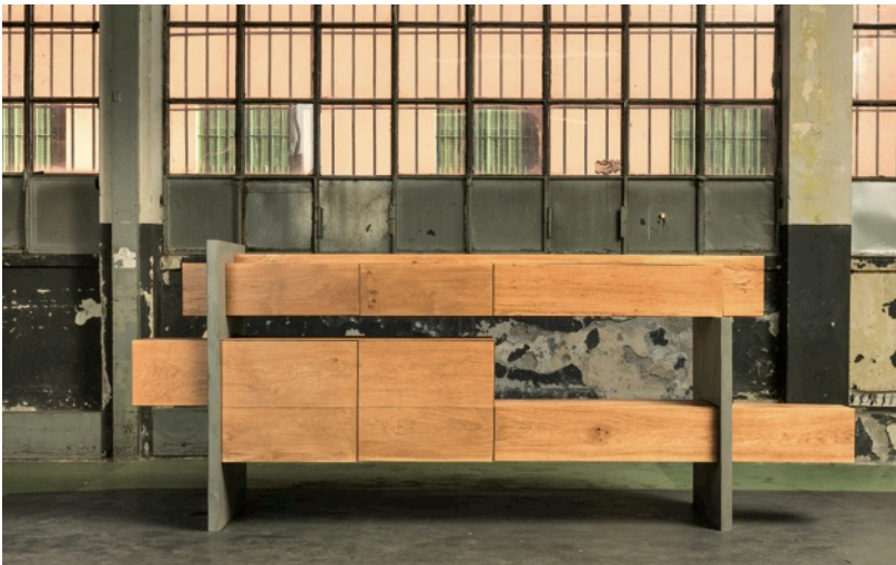
左 : GM 6 CASSETTIERA ALTA/memphis/Giacomo Moor