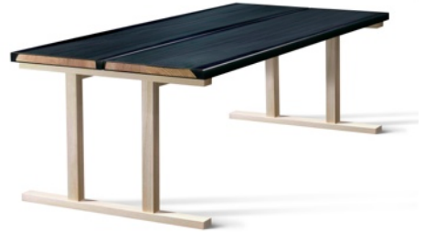
UDUKURI/Established & SONS/Jo Nagasaka