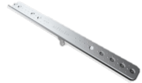
三段式スプレーアーム

ドイツHenkel社のエンジニアで1959年に洗浄力に必要な要素としてSinnerの法則をまとめる