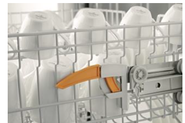
高さ調節可能な上段バスケット