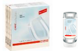
専用洗剤と乾燥仕上げ剤