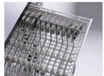
カトラリートレイ