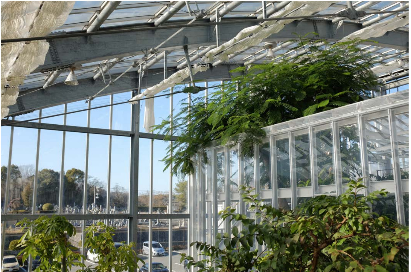
みとろの丘 | 2024 | 加古川市 植物温室だったガラスハウスを屋内公園へと改修したプロジェクト