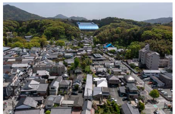
NISHIKIMACHI | 2023 | 太宰府市 コーポラティブ方式で建築した木造平屋の商業建築