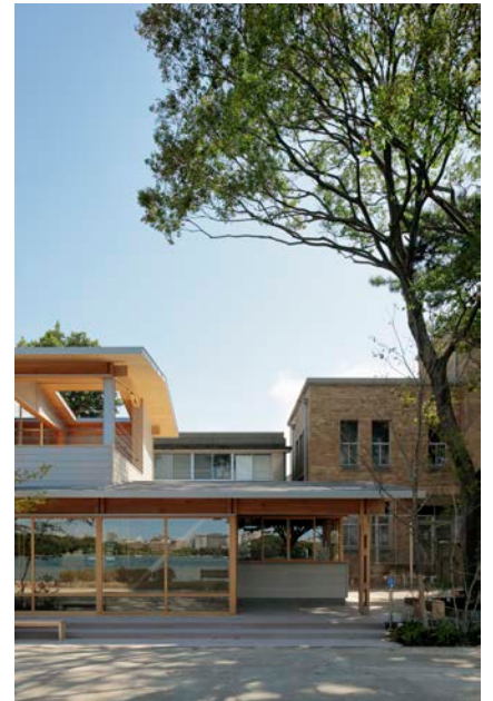
大濠テラス | 2020 | 福岡市 オリジナルのCLT材と木柱を用いてD.I.Y.で構造 フレームを建築した休養施設