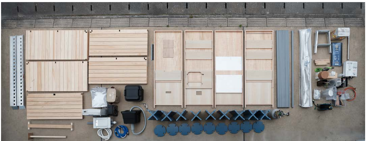
megane coffee & spirits | 2019 | 福岡市 上下昇降する屋根構造によって折り畳み可能な屋台建築 ©rhythmdesign