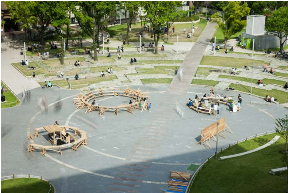
デザイン展2013 | 2013 | 福岡市 学生とのD.I.Y.ワークショップで製作した仮設のイベント会場