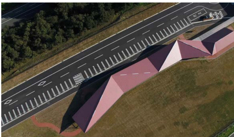
菊鹿ワイナリー アイラリッジ | 2018 | 山鹿市 この場所から見える風景を繋ぎ合わせる屋根を持つ公共の集客施設