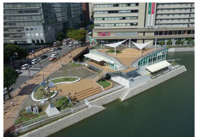
水上公園シブスガーデン | 2016 | 福岡市 屋上を公園の延長として設計した水際の休養施設