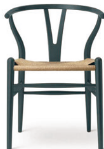
10月 NORTH SEA