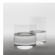
ANDO'S GLASS S/T 株式会社アンドーギャラリー 2014年グッドデザイン金賞 デザイン: Jasper Morrison