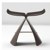
バタフライズツール 株式会社天童木工 1966年グッドデザイン賞 2016年ロングライフデザイン賞