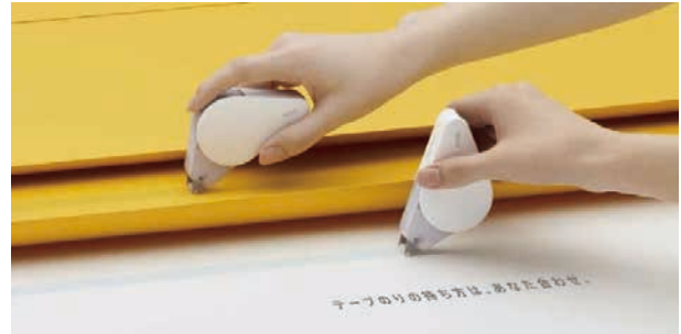
持ち方えらべるテープのり