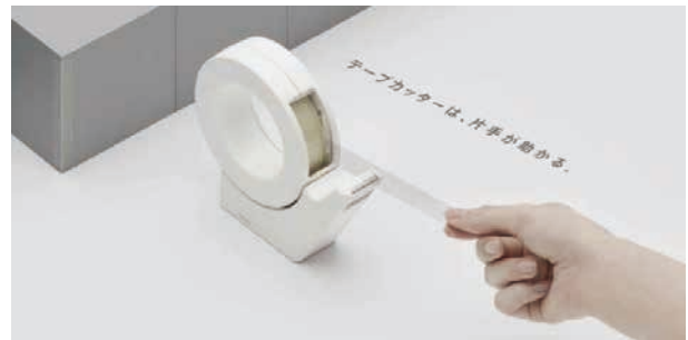
片手で軽く切りやすいテープカッター