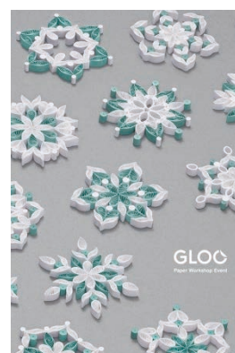
GLOO Paper Workshop Event