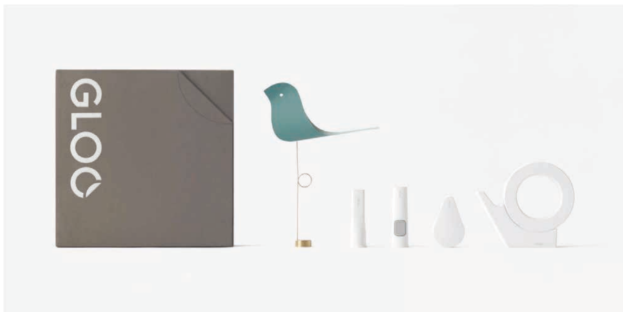
GLOO BOX

コクヨ株式会社（本社：大阪市／社長執行役員：黒田英邦）は、シンプルなデザインと、高い機能性・使いやすさを追求した接着・粘着用品の新ブランド「GLOO（グルー）」の発売を記念し、「“貼る”ってこんなに変わる」というコンセプトを体験できるスペシャルアイテム「GLOO BOX（グルーボックス）」を、12月5日（水）より全国の一部店舗、数量限定で発売します。また12月7日（金）から9日（日）まで、コクヨが運営するライフスタイルショップ「THINK OF THINGS（シンクオブシングス）」にて「GLOO」の「“貼る”楽しさ」を体験できるイベントを開催します。