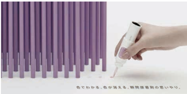
色が消える瞬間接着剤