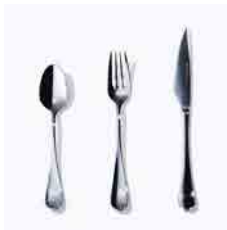
サクライ 機能美を追求する洋食器の工場