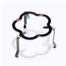
ヤマトキ製作所 五徳に雨どい、ねずみ捕りまで