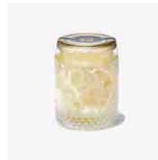
三条果樹専門家集団 三条市に代々続く梨農家が集結