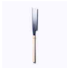
白井産業 一点豪華主義、鋸づくりの技