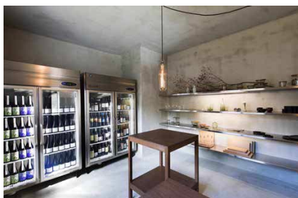
LABO LIQUID 店内