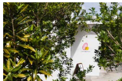
宗像発酵研究所外観