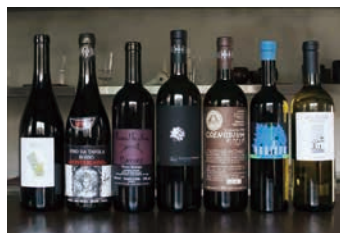
ヴィナイオータが取り扱うワイン (イメージ)