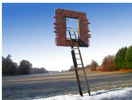
レアンドロ・エルリッヒ < Window and Ladder - Too Late to Ask for Help > 2008