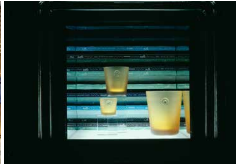
Hermes Window/Tokyo, 2005