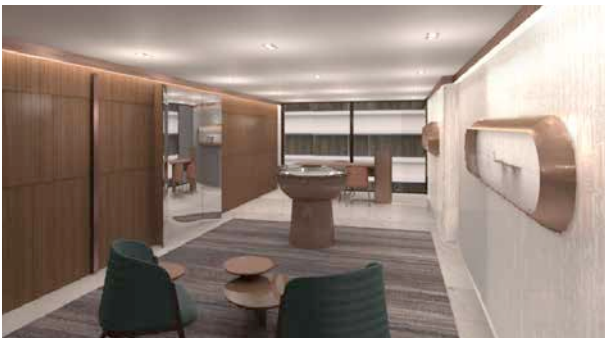
Officine Panerai boutique/Hong Kong