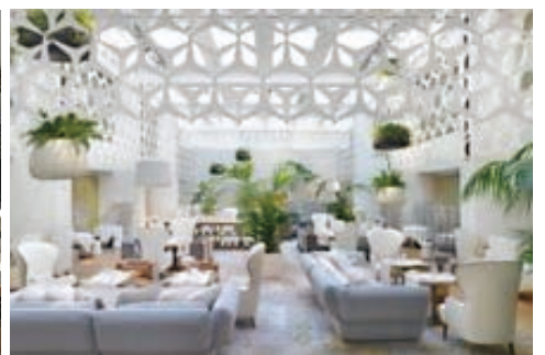
全て Mandarin Oriental Barcelona