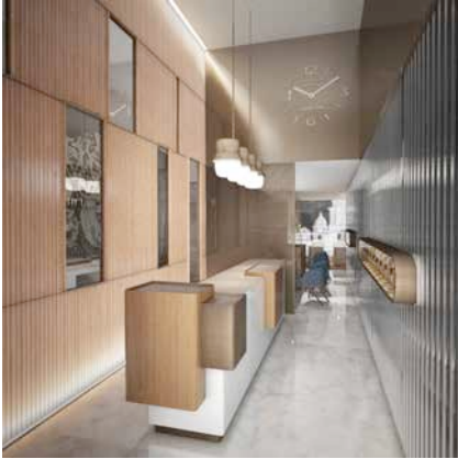
Officine Panerai boutique/Paris