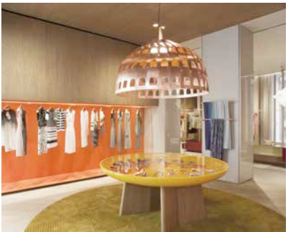
Missoni flagship store/Milan