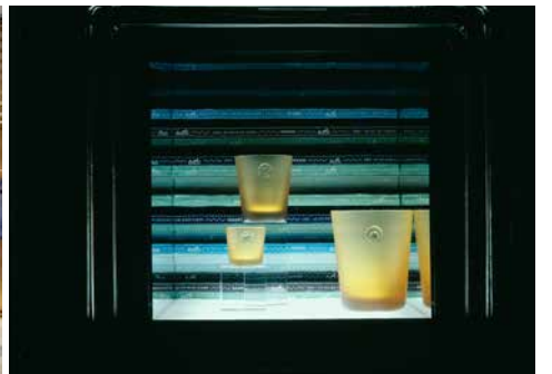
Hermes Window/Tokyo, 2005