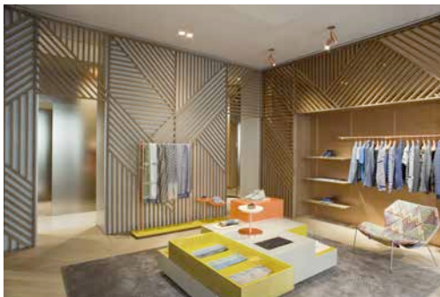
Missoni flagship store/Milan