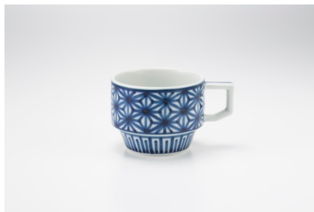
「長崎 波佐見焼 HASAMI BLOCKMUG 麻の葉手描き染付」 価格：6,000円（50個限定）