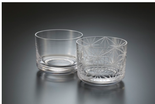
「東京 江戸切り子グラスセット（麻の葉文／無地）」 価格：12,000円（200個限定）

モノポリーの盤上にも登場する工芸品を、弊社のパートナー企業や工芸産地を代表するメーカーと共同で製作しました。産地の技と思いを集結させた、今回限りの数量限定品です。商品は「大日本市博覧会 東京博覧会（2016年1月13日～17日）」で先行販売。2016年2月7日から3月1日まで「中川政七商店」ブランド全店で展開する企画展「日本全国工芸の旅」でも販売いたします。