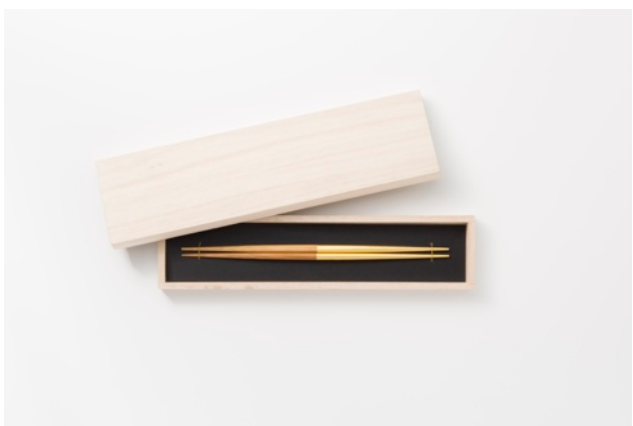
「石川 金沢箔 拭き漆金箔箸」 価格：5,000円（300セット限定）