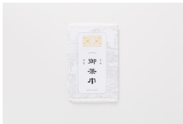
「奈良 本麻 御茶巾」 価格：900円（500個限定）