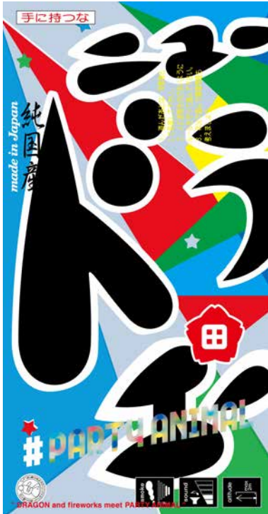
本展覧会イメージビジュアル

前後左右の難しいことばかり考えず、とにかく楽しむための作品を作りたい。あの頃を取り戻したい。そんなことを考えながら作品づくりを進めていく中で、主役たち(=花火たち)が着る服は、やはり、オシャレな方がいい、カッコイイ方がいい、カワイイ方がいいという思いが強くなり、fireworksと太田煙火とのコラボレーションによって作られるPARTY ANIMALが誕生し、展示に至ることになりました。