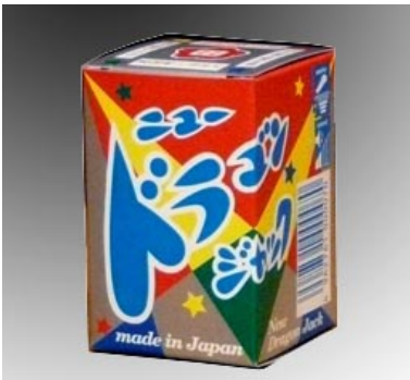
オリジナルドラゴン

昭和3年創業の煙火製造業社。主に「ドラゴン」という噴出花火を作り続け、現在では10種類以上の噴出花火を製造しています。愛知県岡崎市の株式会社太田煙火製造所でうみだされる、ひとつひとつ手作りの純国産のおもちゃ花火は、三河花火の伝統を守りつつ、新しい商品が誕生しています。