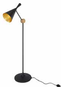
BEAT FLOOR COPPER