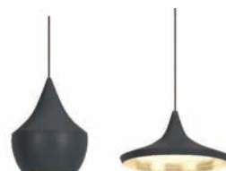
BEAT PENDANT BLACK