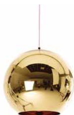
COPPER PENDANT BRONZE