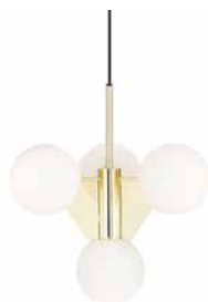
PLANE SHORT CHANDELIER