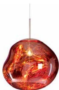
MELT PENDANT COPPER