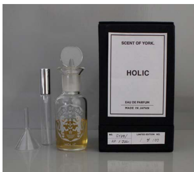
アトマイザー用ロート、アトマイザー、香水瓶、ボックス