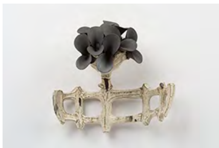
すずきたもつ ハナ 2009年