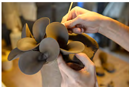
すずきたもつ 製作風景