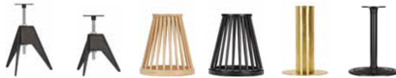
Screw Café Base H 570-820 W 497 D 546 Screw Side Base H 450-620 W 422 D 460 Fan Natural Base H 450 W 400 D 400 Fan Black Base H 450 W 400 D 400 Tube Base H 700 W 500 D 500 Roll Base H 680 W 560 D 560