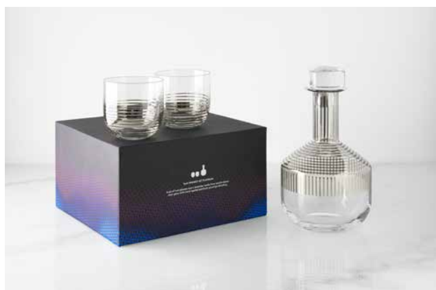
TANK WHISKEY SET PLATINUM STRIPE ¥36,000 セットアイテム：DECANTER x 1、GLASS x 2

サイズ ICE BUCKET H22 x W22 x W21 TONG H25 x W7