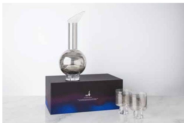
TANK JUG SET PLATINUM STRIPE ¥40,000 セットアイテム：JUG x 1、GLASS x 2

サイズ WHISKEY DECANTER H23 x W13 x W13 GLASS H8 x W8.5 x D8.5