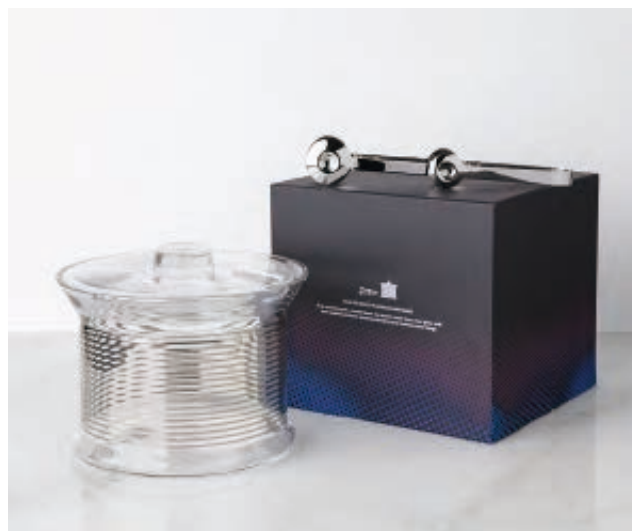
TANK ICE BUCKET PLATINUM STRIPE & TONGS ¥32,000 セットアイテム：ICE BUCKET x 1、TONG x 1

サイズ ICE BUCKET H22 x W22 x W21 TONG H25 x W7