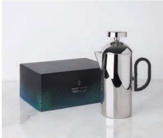
BREW CAFETIERE STAINLESS STEEL ¥27,000