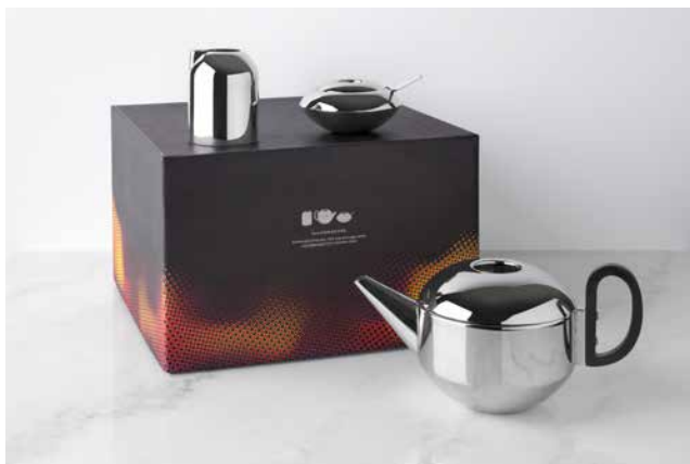
FORM STAINLESS STEEL GIFT SET ¥45,000

FORMは伝統的なアフタヌーンティーを楽しむためのティーセットのデザインを、現代風にアレンジしたコレクションです。今回、ブラス（真鍮/ゴールド）色を基調としていた従来版のアップデート版として、鏡面ステンレス仕上げの新色を発表します。従来版とは異なる素材としてステンレス・スチールを採用し、優れたデザインを継承しつつよりお手入れがしやすく、普段使いでご使用いただける商品になりました。