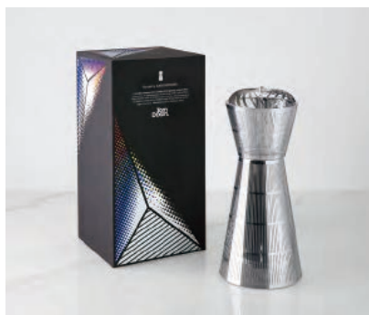
ROYALTY CAGE DIFFUSER ¥25,000 サイズ H25.5 x W11 x D11

赤レンガや公園に自生するクロッカスやイラクサ、そしてロンドン郊外のダゲナムに流れるテムズ川のほのかな塩の香りをお楽しみいただけます。