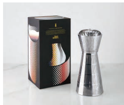
ORIENTALIST CAGE DIFFUSER ¥25,000 サイズ H25.5 x W11 x D11

アールグレーを淹れたポットにスコーンとイチゴジャム、その横には52年製の古ぼけたレザーシートのパントリーが停まっている情景にインスピレーションを受けた香りです。