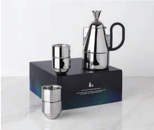
BREW GIFT SET STOVE TOP STAINLESS STEEL ¥40,000

コーヒーを煎れたり、飲むことを茶道的な所作と捉え、その所作をアートに昇華させるアイテムとして発売されたBREW コレクション。現行のカッパー素材の商品同様、周囲の景色を映しこむ鏡面仕上げを施し、保温効果が高いダブルウォール構造のエスプレッソカップなど、機能的かつ、よりクリーンでシャープな印象を与えるステンレスカラーを追加しました。