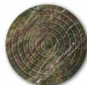
ROCK SERVING BOARD CIRCLE