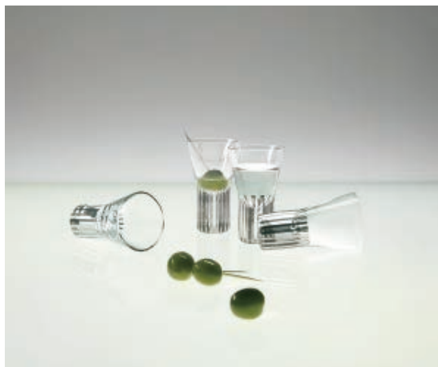
TANK SHOT GLASSES PLATINUM STRIPE ¥18,000 セットアイテム：GRASS x 4

今回、機能美と造形美を追求したグラスウェアコレクション、TANKのニューコレクションとして、今回、プラチナカラーのストライプが施されたデザインを発表します。従来のTANKの特徴である、太いラインを用いた大胆なデザインとは一線を画し、繊細で細いストライプの模様をあしらい、よりミニマルな印象を与えるデザインへとアップデートしました。フォルムは、従来のTANKシリーズを踏襲していますが、新たな模様により、新鮮な印象に生まれ変わりました。