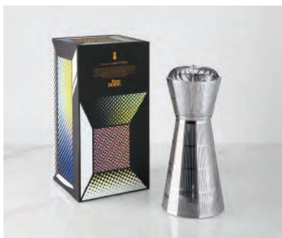
LONDON CAGE DIFFUSER ¥25,000 サイズ H25.5 x W11 x D11