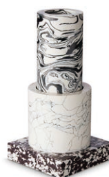
SWIRL SMALL VASE H 26 x W 13 x D 13 cm ¥58,000