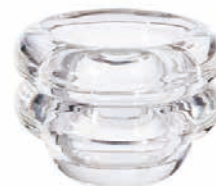
PRESS TEALIGHT HORIZONTAL H 7 x W 9.5 x D 9.5 cm ¥6,300