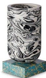
SWIRL MEDIUM VASE H 29 x W 14.5 x D 14.5 cm ¥80,000