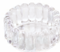
PRESS SMALL BOWL H 8.5 x W 18 x D 18 cm ¥14,000