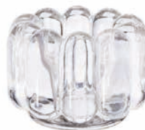
PRESS TEALIGHT VERTICAL H 7 x W 9.5 x D 9.5 cm ¥6,300