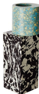
SWIRL LARGE VASE H 45 x W 15 x D 15 cm ¥98,000