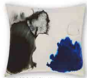
BLOT CUSHION 60cm x 60cm