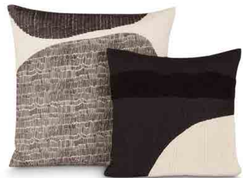
STITCH CUSHION 60cm x 60cm