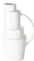
BLOCK JUG H 350 x W 183 x D 183 ¥31,000