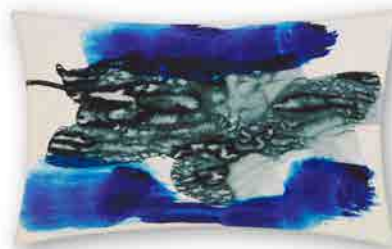
BLOT CUSHION 40cm x 60cm

ブラックとブルーがおりなす抽象画のようなデザインは、スプラッシュ・ペインティングで構成されています。Tom Dixonの頭の中で起きていたカオスを垣間見たもの、と表現するのが一番しっくりするような、心の中の創作の思いが具現化されたものともいえます。トム・ディクソンは、最新のデジタル・プリントの技術がもたらす画像再現精度の高さとスピードに魅了され、また、夜遅くまで働くなか、子ども時代に夢中だったクロマトグラフィーと抽象的表現主義、ロールシャッハテストで使われるイメージを融合させました。吸収性のあるリネン布に直感的デザインをカラープリンティングで染み込ませることに成功し、抽象的で心理的感覚を目に見える形で表現したデザインになっています。