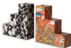
SWIRL STEPPED BOOKENDS SET OF 2 H 150 x W 150 x D 50 ¥40,000