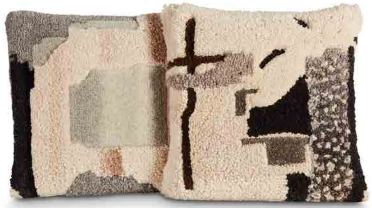
ABSTRACT NATURAL 45cm x 45cm