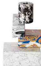
SWIRL MULTI CANDELABRA H 245 x W 190 x D 160 ¥58,000