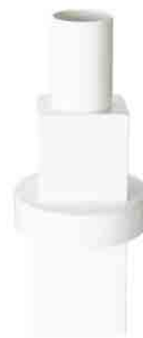
BLOCK VASE LARGE H 535 x W 230 x D 230 ¥45,000