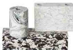
SWIRL BLACK & WHITE CANDELABRA H 170 x W 275 x D 120