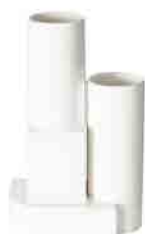
BLOCK VESSEL H 265 x W 170 x D 170 ¥26,500