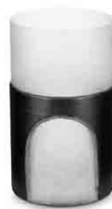
CARVED VASE MEDIUM BLACK H 390 x W 102 x D 102 ¥42,000