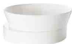
BLOCK BOWL H 120 x W 300 x D 300 ¥31,000