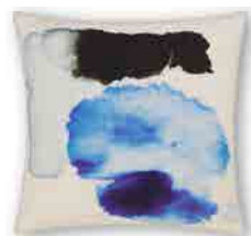
BLOT CUSHION 45cm x 45cm