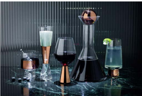
既存のTANKシリーズより

技術的に難易度の高い上質なクリアガラスと黒ガラスのコンビネーションが特徴的な新ラインアップは、ミステリアスな表情を纏い、ウィンターシーズンのギフトにも最適です。