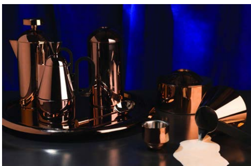
既存のBREWシリーズより

実用的な器具ながらも、ステンレススチールに黒のフィニッシュが施された個性が光るコーヒーセットは、日々のコーヒータイムをより豊かなものへと導きます。