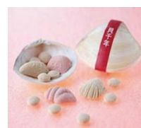
<貝千年> 福島県に本店を構える老舗による和三盆糖の詰合せ。良縁をもたらす縁起物として、また夫婦相合の象徴として人気の逸品