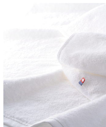
今治市（愛媛県） 強く優しいものづくりのある街