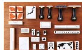
<水縞> 水玉好きのデザイナーと縞々好きの文具店店主が二人の目線を通して製作、セレクトする楽しさをプラスしたステーションリーブランド