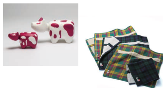
<華ひらく> & <ISETAN TARTAN> 会津の職人が手がけた張子べこや、今治産のタオルなど、日本各地の作り手と協業した拘りのあるオリジナルアイテム