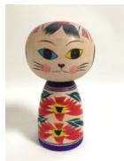
<山形市> 山形こけし ネコこけし 伝統技法を受け継ぎつつも今の暮らしに馴染む、愛らしいこけし