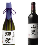
人気銘柄の<獺祭>をメインにハーフサイズの日本酒やスパークリング清酒、デザインのかわいいカップ酒など女性にも手に取りやすい日本酒や、近年人気の日本ワインなど数多く紹介