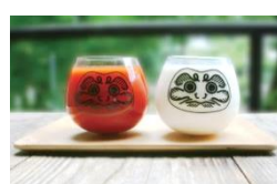
<Floyd> 人々に感動と驚き、そして微笑みを届けることを使命とする三島発のプロダクトレーベル