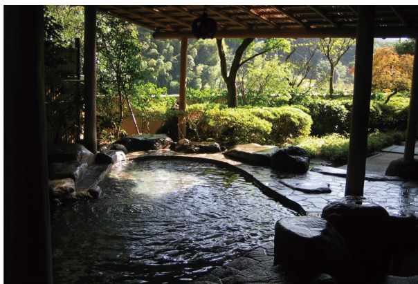
湯河原町（神奈川県） 自然のいぶきを感じる温泉郷