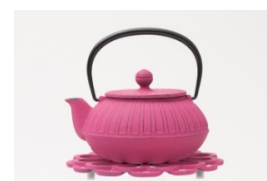
<アンシェンテ ジャпон> フランスの紅茶専門店“アンシェンテ”から、お茶を愛する専門家として特別に日本でのプロデュース販売を許された「南部鉄器カラーポット」