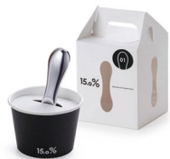
<高岡市> 鋳物 15.0% アイスクリームスプーン アルミニウムの熱伝導率の高さを利用して冷凍庫で凍ったアイスクリームをすくうと、瞬時に食べ頃に

出展自治体の持つ様々な特産品を、テーマに合わせて編集します。2-3月は、“TABISURU温泉”をテーマに、ご当地の温泉グッズや温泉街を彷彿する面白グッズなどを紹介。また、「旅するカフェ」前では足湯イベントを開催します。