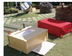
<湯河原町> 足湯 「旅するカフェ」前には、足湯が登場