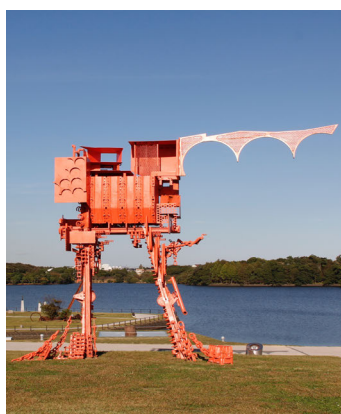
宇部市（山口県） アートと笑顔が咲く街