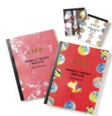
<nippoppin> ネオジャポニズムなファインアートの世界「CANDY GIRL」と鮮やかな色で書き心地も優れたノーブルノートとのコラボレーション