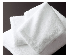
<今治市> 今治タオル 軽さ、柔らかさ、ふくらみの全てにおいて、使うたびに幸せを感じるタオル