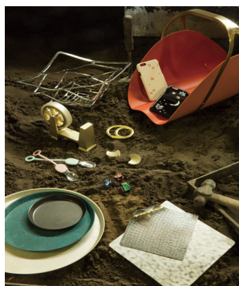
高岡市（富山県） ものづくりの粋と華が出会う街