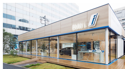
③BMW i Megacity Studio