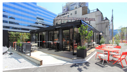
①グッドモーニングカフェ&グリル