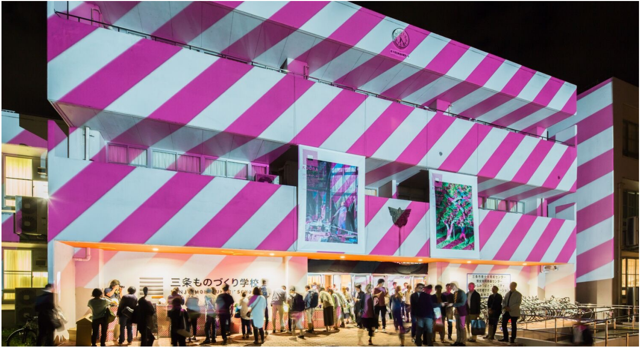
2016年オフィシャルレセプション風景

「燕三条 工場の祭典」は、今年も毎晩、夜の工場を開き、参加企業のKOUBAを舞台にレセプションを開催し、工場の作業から離れた職人たちとの交流の場として開放しイベントを実施するほか、各工場環境を活かしたイベントの実施を予定しています。燕三条地域の工場を巡る旅、夜の部もぜひお見逃しなく。