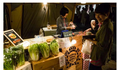
2016年オフィシャルレセプション風景