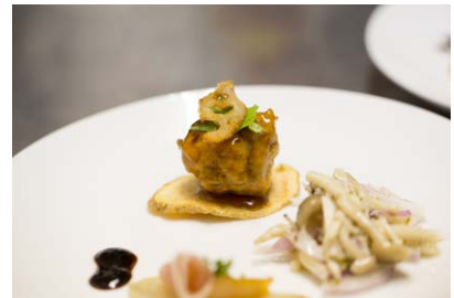
2016年三条果樹専門家集団レセプション風景 ©「燕三条 工場の祭典」 実行委員会