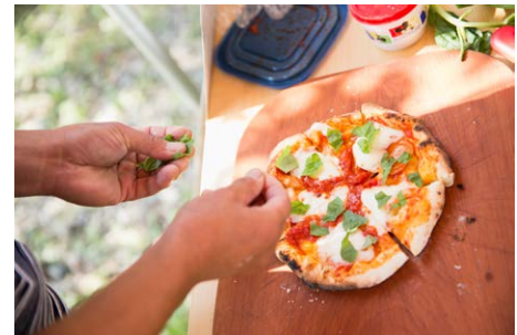
イメージ写真 ©「燕三条 工場の祭典」 実行委員会

申込 TEL 0256-93-2002 (越後味噌醸造) EMAIL kiryu@echigomiso.co.jp