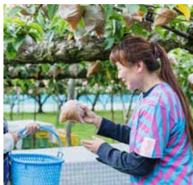
耕場のユニフォーム