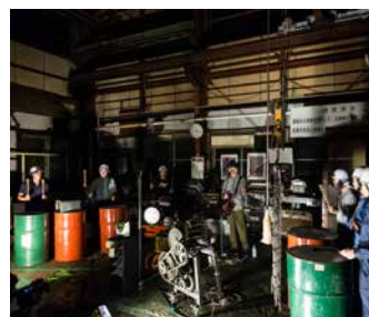
株式会社テーエムを中心とした「奏でる工場」