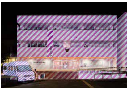
三条ものづくり学校

今年も夜の工場を開きます。各工場を舞台にレセプションを開催し、工場の作業から離れた職人たちとの交流の場としてイベントを実施します。今年は更に盛りだくさんの内容で皆様をお迎えします。燕三条地域の工場を巡る旅、夜の部もぜひお見逃しなく。