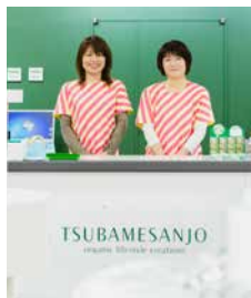
購場のユニフォーム