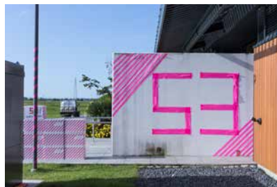
道の駅 庭園の郷保内