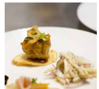
三条果樹専門家集団