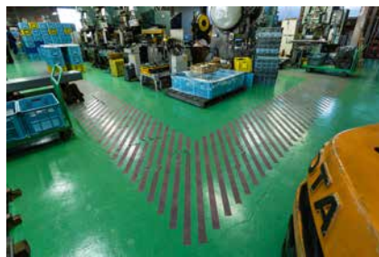
永塚製作所の装飾