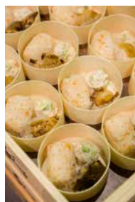
三条ものづくり学校