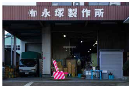
永塚製作所の装飾