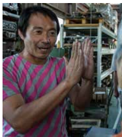
工場のユニフォーム

これまで燕三条地域では、火の赤と金属の黒を象徴し、赤と黒によって金属加工の産地を表現してきました。「燕三条 工場の祭典」では、ロゴやブックレットなどのアートディレクションをクリエイティブユニット「SPREAD」が担当。金属加工時に使用する炉を覗くと炎に含まれる鮮やかな「ピンク」が目を引くこと、工場の素材や工場自体の色には「シルバー」が多く見受けられることから、これまでの「赤と黒」のイメージを「ピンクとシルバー」に刷新しました。また、斜め45度の黄色と黒のストライプで表現される立ち入り禁止区域の標識にも着想を得ています。参加企業は、事前に配布されたピンクの「テープ」とピンクストライプの「段ボール」を使用し、工場の入口から内部、また近隣を含む町の至る所に誘導サインや看板を設置するなど、それぞれが工夫を凝らし、来場者を迎えています。また2016年より、工場の祭典のピンクxシルバーに加え、耕場の祭典は太陽と水をイメージしたピンクxブルー、購場の祭典は愛と経済をイメージしたピンクx黄色のテーマカラーが誕生し、それぞれのKOUBAは各自テーマカラーのTシャツをユニフォームとして着用しています。