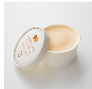
丸房露のためのアイスクリーム