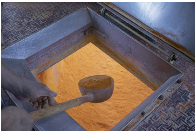
混和 熟成 仕上げ