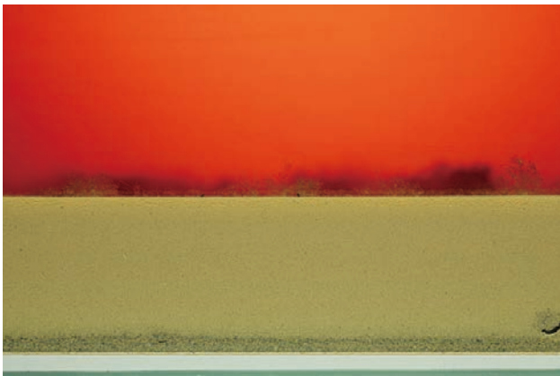
別府湯の花 浸漬精製法

湯の花エキスを湯に溶かすと強い酸性のお湯になります。一般的に酸性の温泉は殺菌作用が期待されますが、刺激が強いので湯あたりに注意が必要です。そのため特性を活かしつつも、ご家庭で毎日お使いいただける理想的なお湯を求めて、湯の花エキスを肌にやさしくなめらかな湯質が特長のアルカリ性温泉の成分と掛け合わせます。酸性の湯の花エキスと正反対のアルカリ性成分を混ぜ合わせると激しく反応するため、温熱と冷却を加えることにより反応を制御しながら両者を一体化させます。さらに製品がお客様の手に届いた後も、長く安定した品質を保てるよう、20時間以上かけて熟成させます。仕上げは、手作りしていた創業当時のままに、現在も熟練の社員が反応を直に確かめながら行っています。