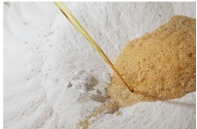
湯の花エキス アルカリ反応の様子